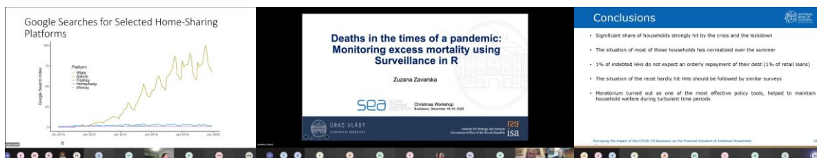
prednášky zo sekcií